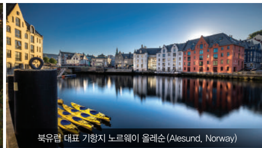
북유럽 대표 기항지 노르웨이 올레순 (Alesund, Norway)

화려한 수상경력에 빛나는 모던 럭셔리 컨셉의 셀러브리티크루즈와 함께 즐기는 유럽 크루즈는 특별함에 품격을 더했습니다. 4월부터 10월까지 한시적으로 운항하는 유럽 크루즈는 유럽 내 크고 작은 80개의 도시 기항과 함께 기항지에서 하루 더 머무르는 다양한 오버나잇 일정을 선보이고 있습니다. 좀 더 특별한 크루즈 여행을 원하는 손님을 위한 프랑스 칸 영화 페스티벌, 브리티시 오픈 등 세계적으로 유명한 페스티벌 일정에 맞춘 셀러브리티의 시그니처 크루즈는 모던하면서도 정통을 지키는 셀러브리티크루즈와 닮았습니다. 가장 인기있는 지중해 기항지인 그리스의 산토리니와 미코노스, 이탈리아의 로마와 베니스, 북유럽 대표 기항지인 러시아 상트 페테르부르크와 핀란드 헬싱키 등 더욱 다양하고 아름다운 유럽의 기항지를 바다 위 가장 아름다운 건축물 셀러브리티크루즈와 경험하세요.