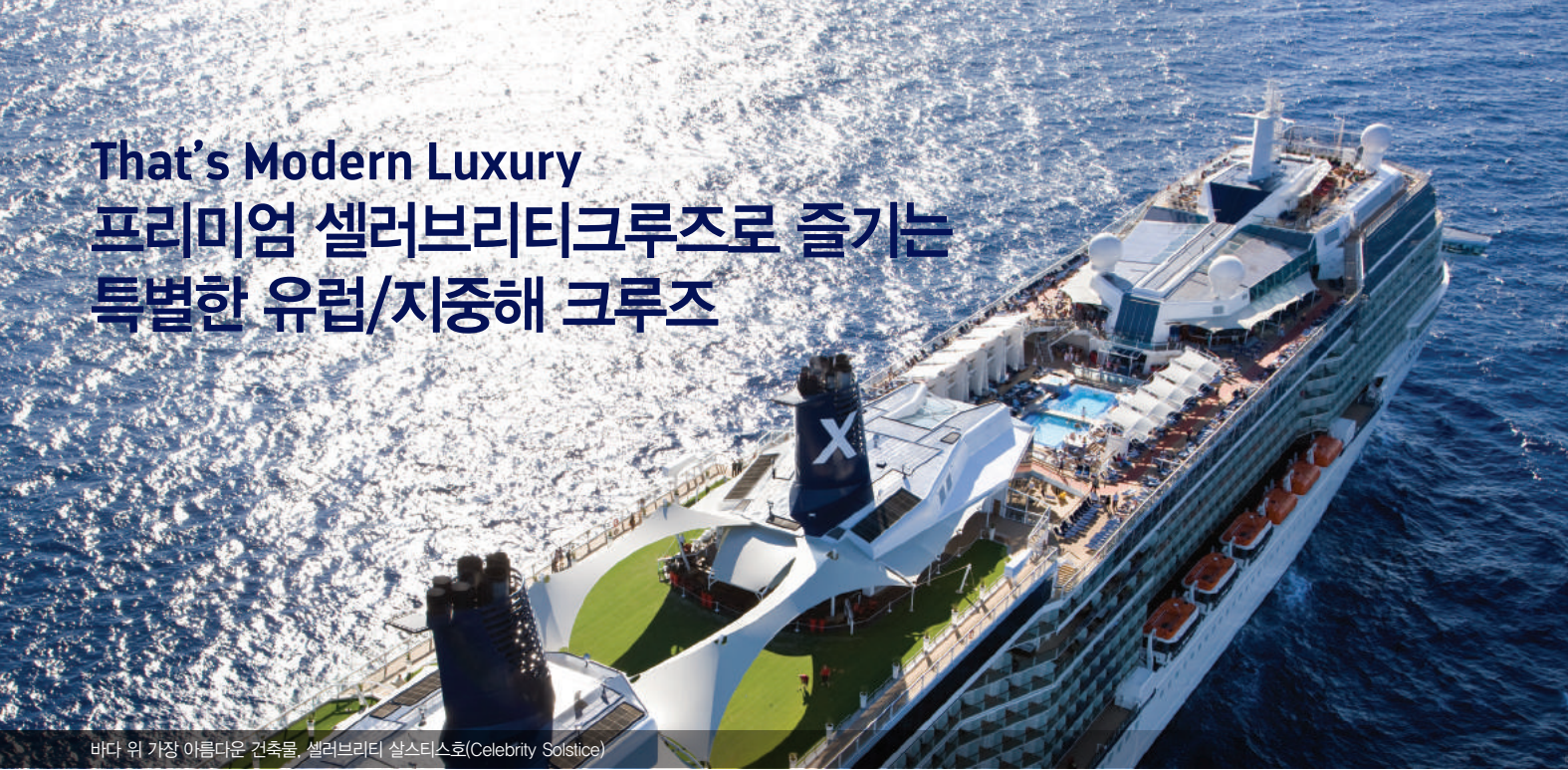
바다 위 가장 아름다운 건축물, 셀러브리티 샬스티스호(Celebrity Solstice)