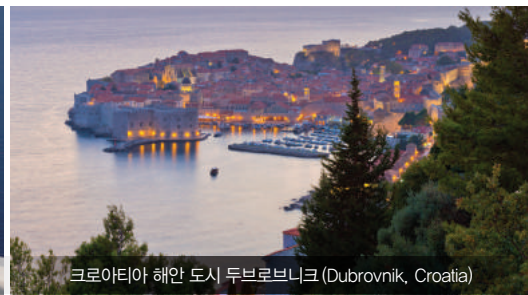
크로아티아 해안 도시 두브로브니크 (Dubrovnik, Croatia)