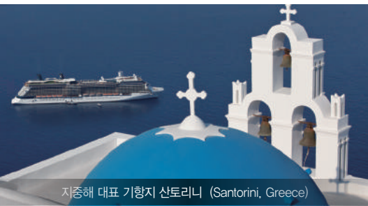
지중해 대표 기항지 산토리니 (Santorini, Greece)